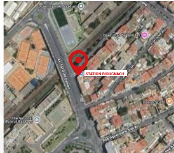
STATION AGDAL BIOGNACH