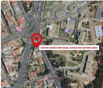
STATION AGENCE INWI AGDAL AVENUE DES NATIONS UNIES