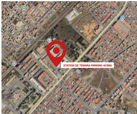
STATION DE TEMARA PARKING ACIMA (MARJANE MARKET)